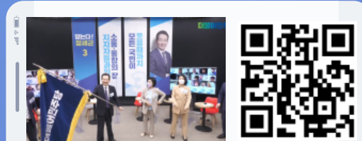
디지털 국민대화 : 정세균 후보 편