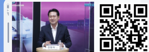
디지털 시민대화 : 장동혁 의원 편